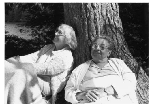
The Company of Strangers Directed by Cynthia Scott Produced by David Wilson © 1990 National Film Board of Canada. All rights reserved.

国の基本計画 [第2分野]男女共同参画の視点に立った社会制度・慣行の見直し、意識の改革、[第8分野]高齢者、障害者、外国人等が安心して暮らせる環境の整備、[第13分野]メディアにおける男女共同参画の推進 名古屋市の基本計画 [目標1]男女の人権の尊重 [目標2]男女平等・男女の自立のための意識改革、 [目標5] 家庭・地域における男女の自立と平等参画