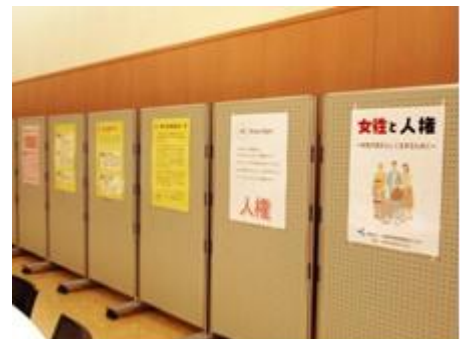
6月7日～26日まで、「女性と人権」をテーマに展示も実施した。

国の基本計画 [第8分野]高齢者、障害者、外国人等が安心して暮らせる環境の整備、